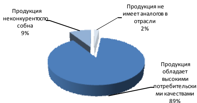
Рис. 1 Конкурентное преимущество продукции промышленных организаций на российском рынке (в % от общего числа организаций)

Также достаточно важным моментом является отсутствие зависимости большинства промышленников от спроса на внешнем рынке (отметили более чем 60% респондентов). Данный факт свидетельствует о необходимости активизации различных мер поддержки и в первую очередь стимулирования внутреннего спроса для малых предприятий, включая импортозамещение.