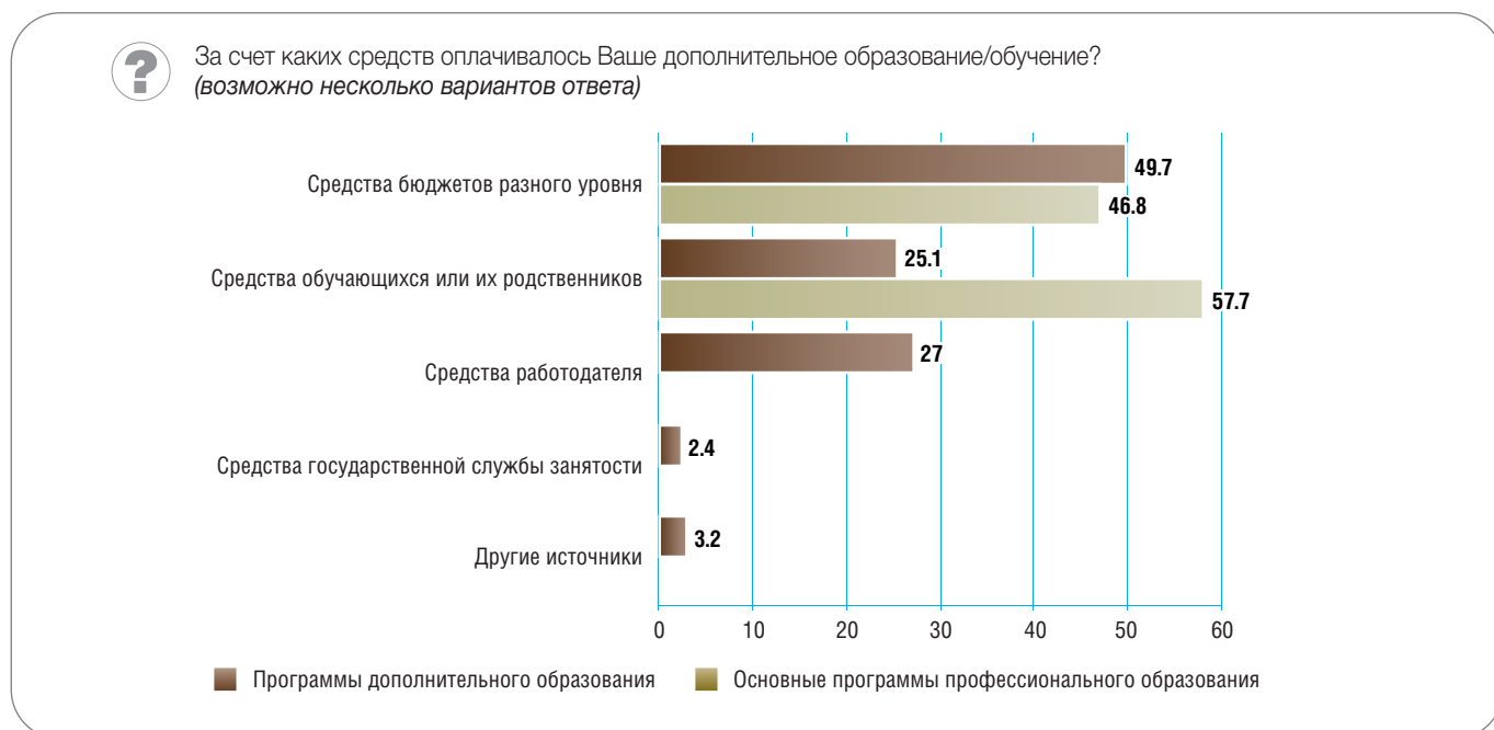
Рис. 3. Источники финансирования непрерывного образования (в процентах от численности ответивших)

нагрузку несет слушатель или его родные, о государственном финансировании заявили 47% опрошенных (рис. 3). По программам дополнительного образования за счет средств бюджетов различного уровня и других государственных органов обучаются немногим более половины респондентов. Заметную роль в оплате программ этого вида играют работодатели: они финансируют обучение 27% респондентов. Домохозяйства несут расходы в четверти случаев.