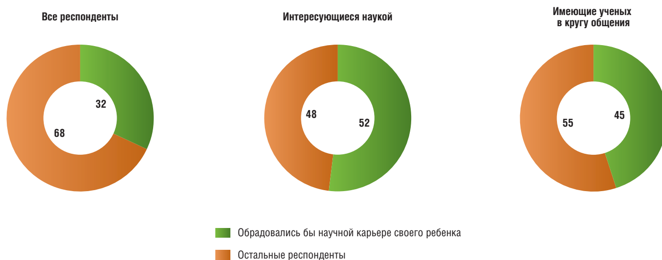
Рис. 2. Отношение к выбору ребенком карьеры ученого среди различных групп населения (в процентах от численности опрошенных соответствующей группы)

респондентов отметили, что их очень интересуют вопросы развития науки и техники. Для сравнения, в США, где научная карьера кажется населению наиболее привлекательной, такой ответ дали 40% опрошенных.