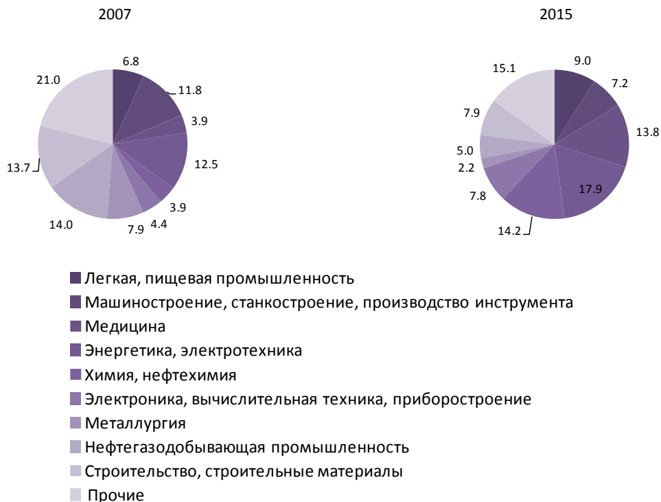
Рис. 2. Распределение заключенных на внутреннем рынке договоров о торговле технологиями по областям техники (%)

Начиная с 2000 г. наибольшую активность в торговле технологиями проявляют негосударственные организации (в 2015 г. их удельный вес составил 65.2% от числа лицензиаров/продавцов и 91.2% — от числа лицензиатов/приобретателей). Доля физических лиц стабильно невысока и составляет 22.1 и 6.1% соответственно. Вклад государственных организаций остается минимальным (12.7% лицензиаров и 2.8% лицензиатов в 2015 г.).