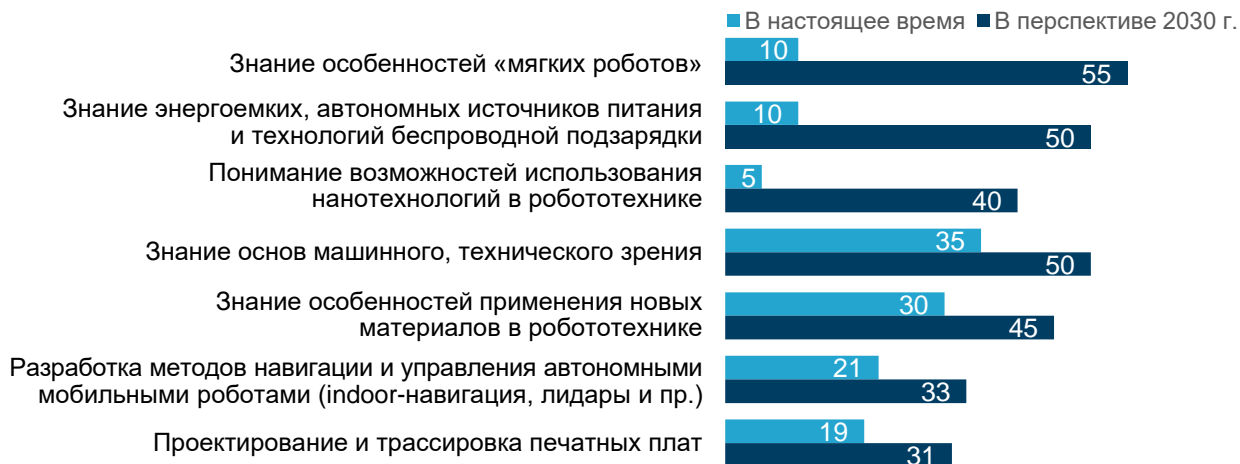
Рис. 2. Востребованность компетенций, связанных с разработкой технологий промышленной робототехники (% ответивших)