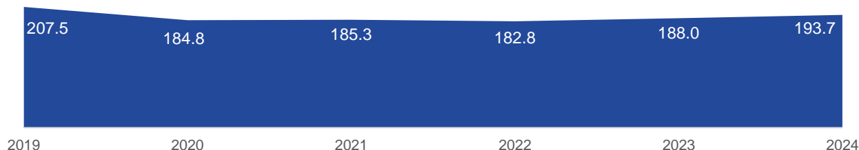
Рис. 1. Число организаций креативных индустрий в России (тыс. ед.)