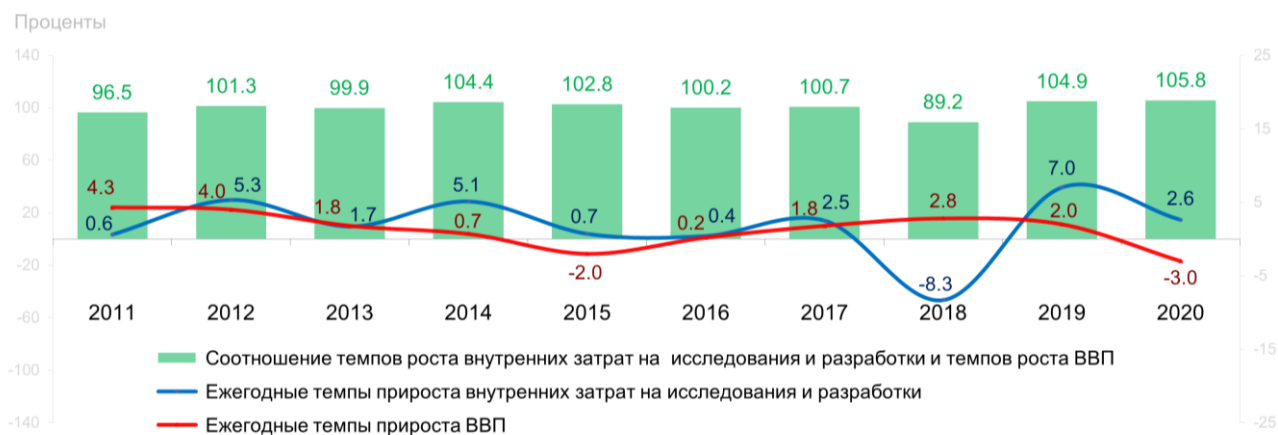
Рис. 2. Соотношение темпов роста внутренних затрат на исследования и разработки и валового внутреннего продукта

Ежегодные темпы прироста внутренних затрат на ИР в отдельные периоды, в том числе в последние два года, опережали динамику валового внутреннего продукта (ВВП) страны (рис. 2). Доля внутренних затрат на ИР в ВВП достигла 1.1%. Россия с учетом данных за 2020 г. находится на 35-м месте по величине данного показателя (за 2019 г. – на 37-м).