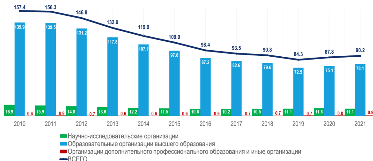
Рис. 1. Численность аспирантов (тыс. человек)

Наблюдается дальнейшее закрепление ведущей роли вузов в подготовке научных и научно-педагогических кадров: здесь обучаются почти 90% аспирантов, причем их численность за последние два года выросла на 7.8% (до 78.1 тыс. человек). На долю научно-исследовательских организаций в 2021 г. приходилось 12.1% аспирантов – 11.1 тыс. человек (на 6.1% меньше, чем в 2020 г.). В организациях дополнительного профессионального образования сохраняется положительная (хотя и малозначимая по масштабам) динамика численности аспирантов, к 2021 г. она достигла 914 человек (1% от общей численности).