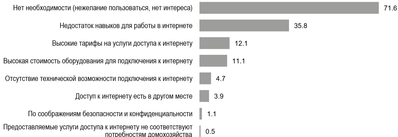
Рис. 2. Причины отсутствия доступа в интернет в домашнем хозяйстве: 2021 (в % от домохозяйств, не имеющих доступа в интернет)

Вслед за снижением доли домохозяйств, не подключенных к интернету, уменьшается и доля россиян, которые никогда им не пользовались: в 2018 г. она составляла 18% в среднем по стране, в 2021 г. – уже 12% (рис. 3). Ожидается, наибольшая их доля сохраняется в регионах с наибольшим удельным весом домохозяйств без подключения к сети: в Новгородской (23.7%) и Орловской (22.9%) областях, республиках Марий Эл (21.1%) и Мордовия (20.7%).