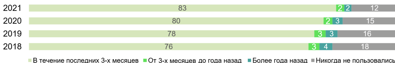
Рис. 3. Последнее использование интернета (дома, на работе, в любом другом месте): 2021 (в % от общей численности населения в возрасте 15 лет и старше)

90.1% россиян, которые никогда не пользовались интернетом, – лица в возрасте 55 лет и старше. Причем если в категории до 55 лет доля тех, кто не пользуется интернетом, не превышает 5%, то в более старших возрастных группах она достаточно высока: в возрастной когорте 55–64 лет – 12.9%, в группе 65–74 лет – 35.5%, а среди россиян в возрасте 75 лет и старше – 69.3% (рис. 4).